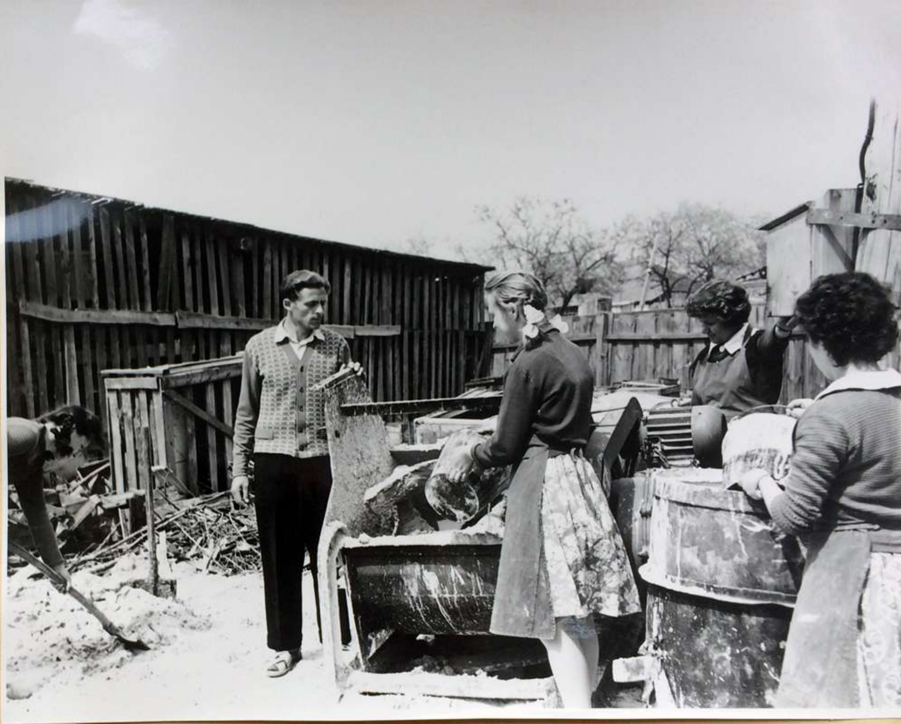
Каменцики. Работа у механизмов.