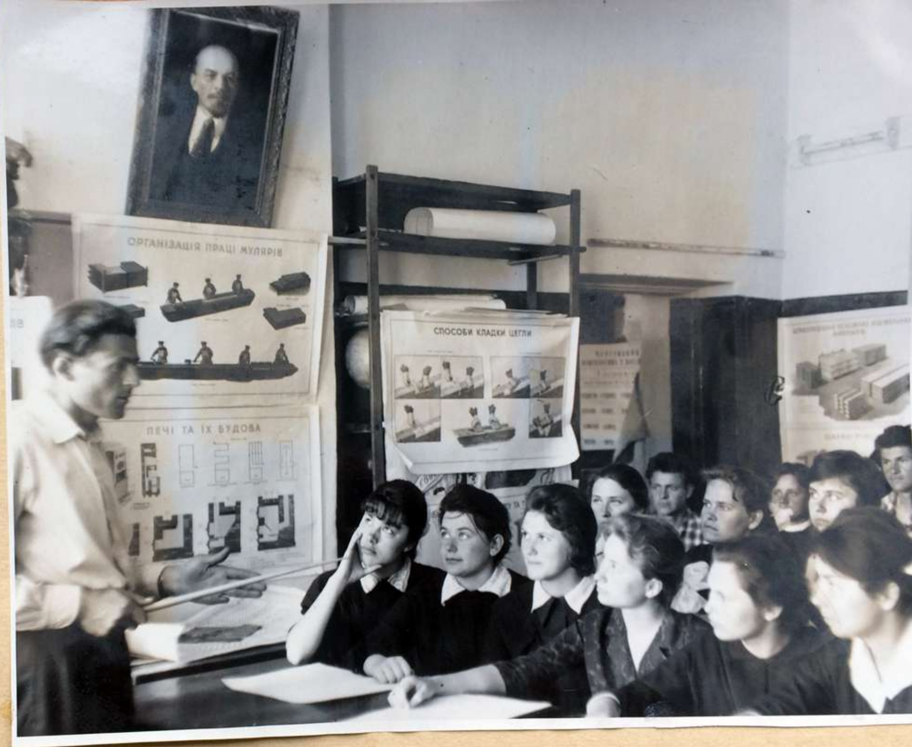
Теоретическое занятие в классе каменщиков.