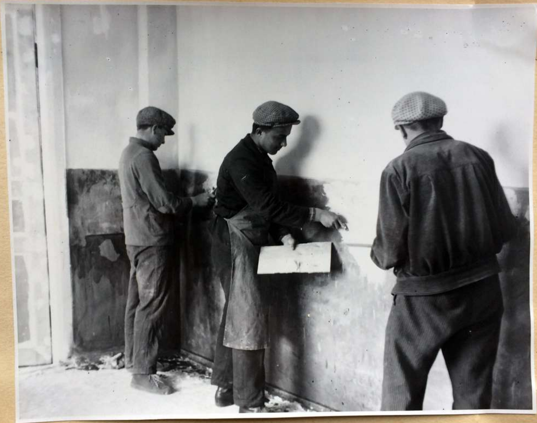
Масляная окраска панелей в яслях