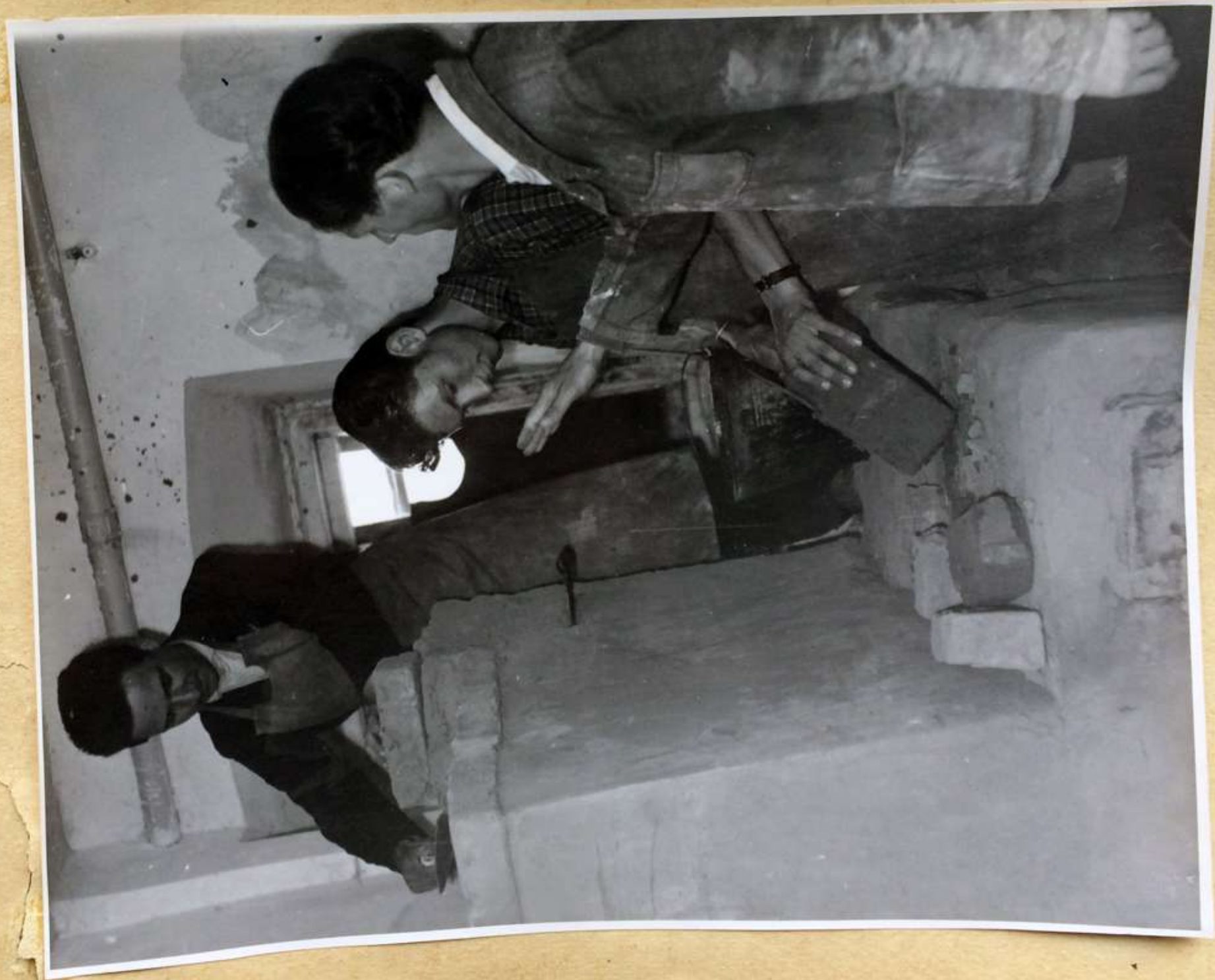
Устройство отопительного очага