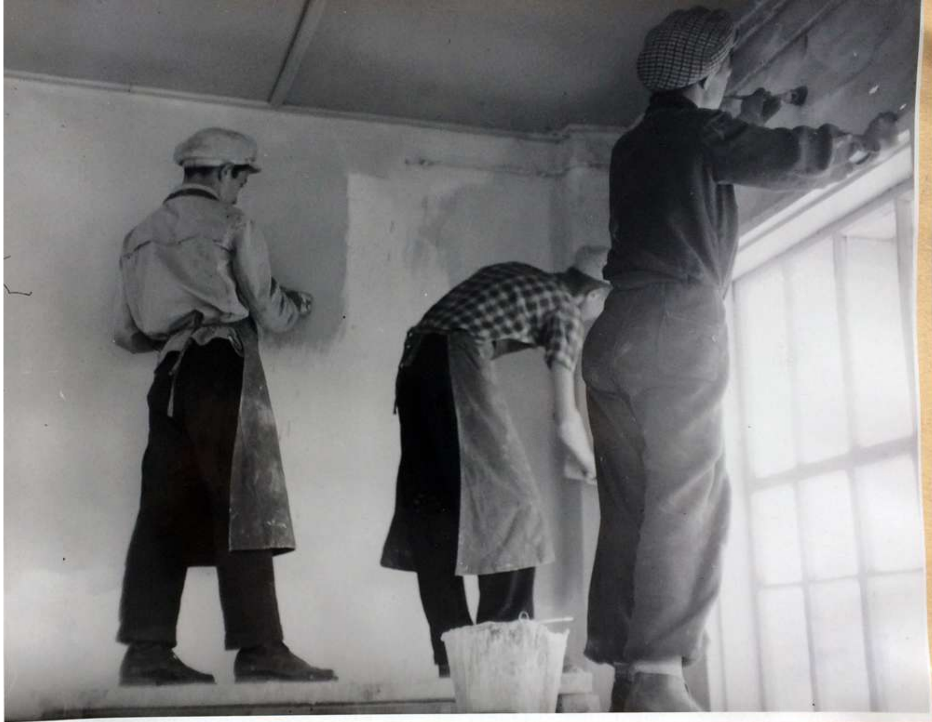
Побелка стен комнат детских яслей.