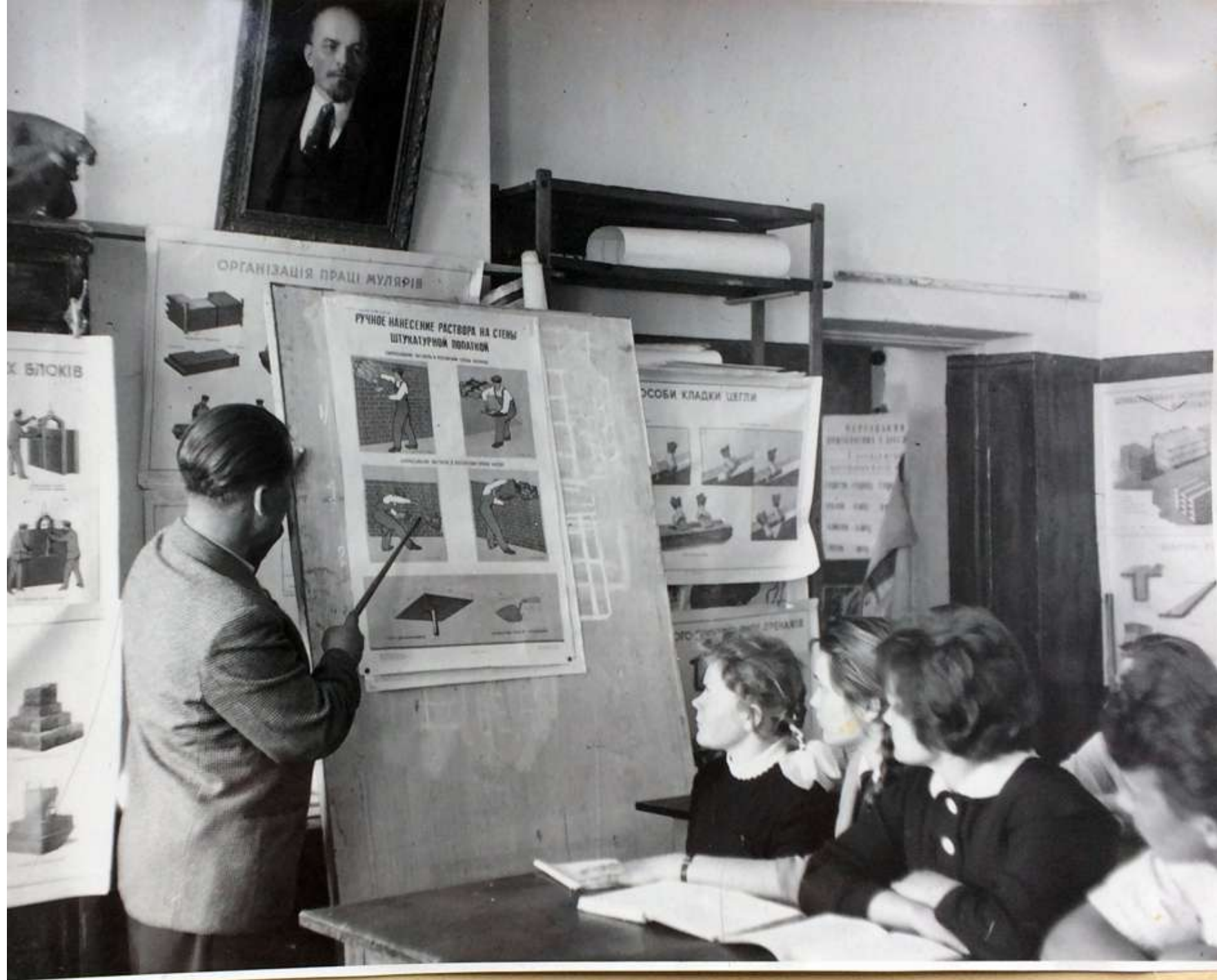
Теоретические занятия в классе штукатуров