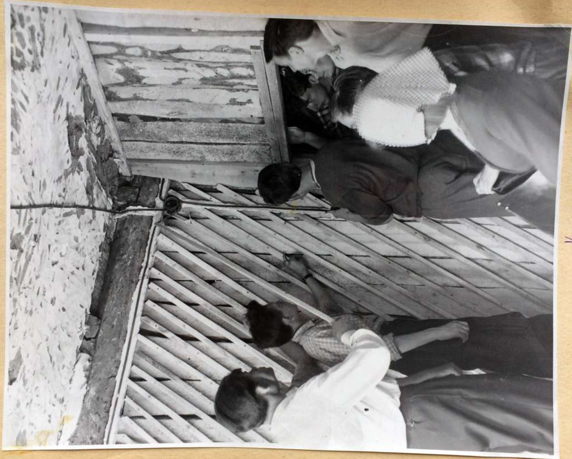
Устройство "кратон" электророзвод 9 км.