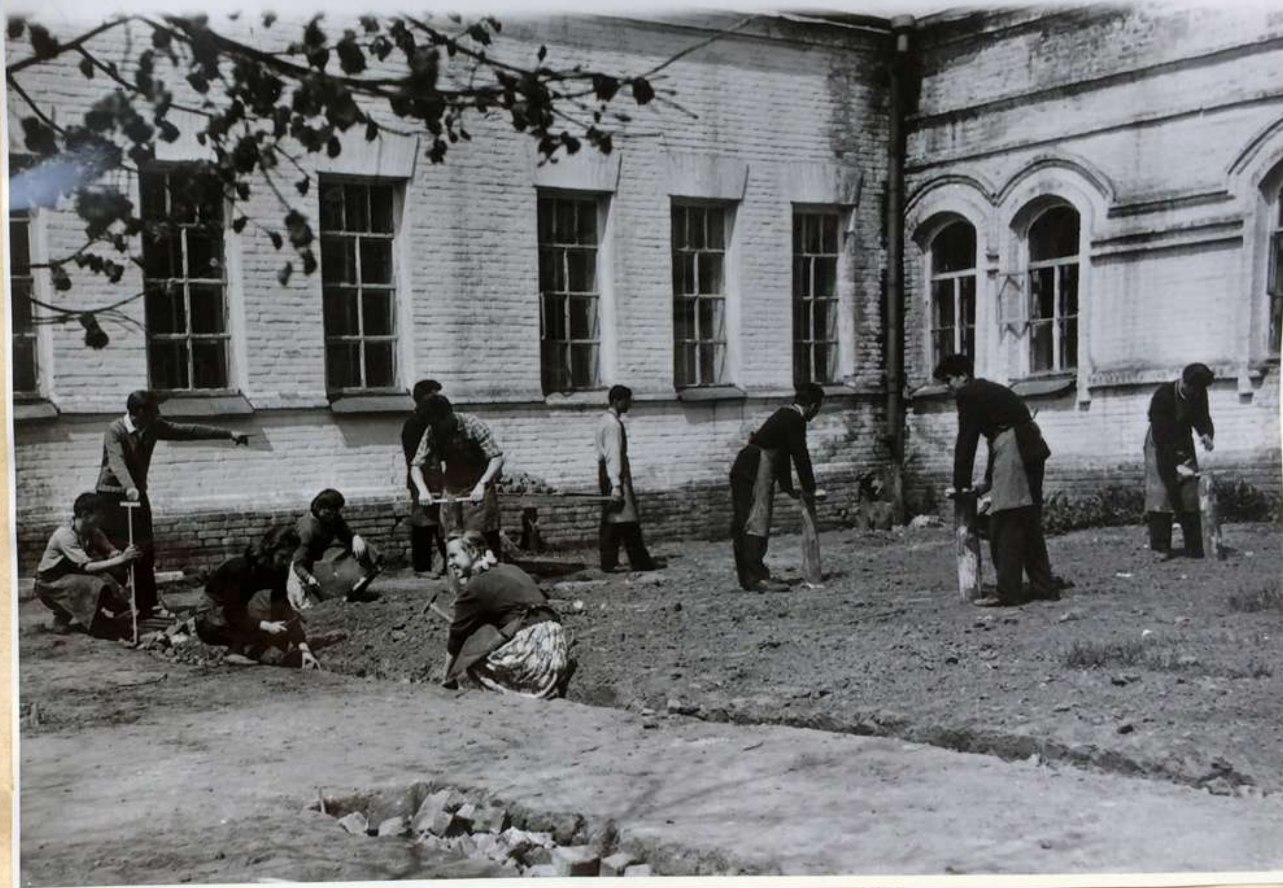
Каменщики. Подготовка (планировка) площадки для научного городка.