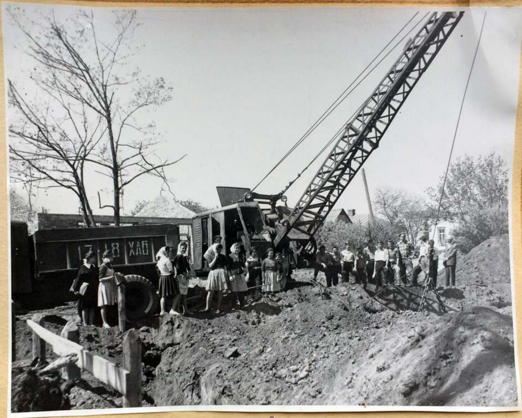
Экскурсия к землеройным машинам. (стр-во селского РК КМУ)