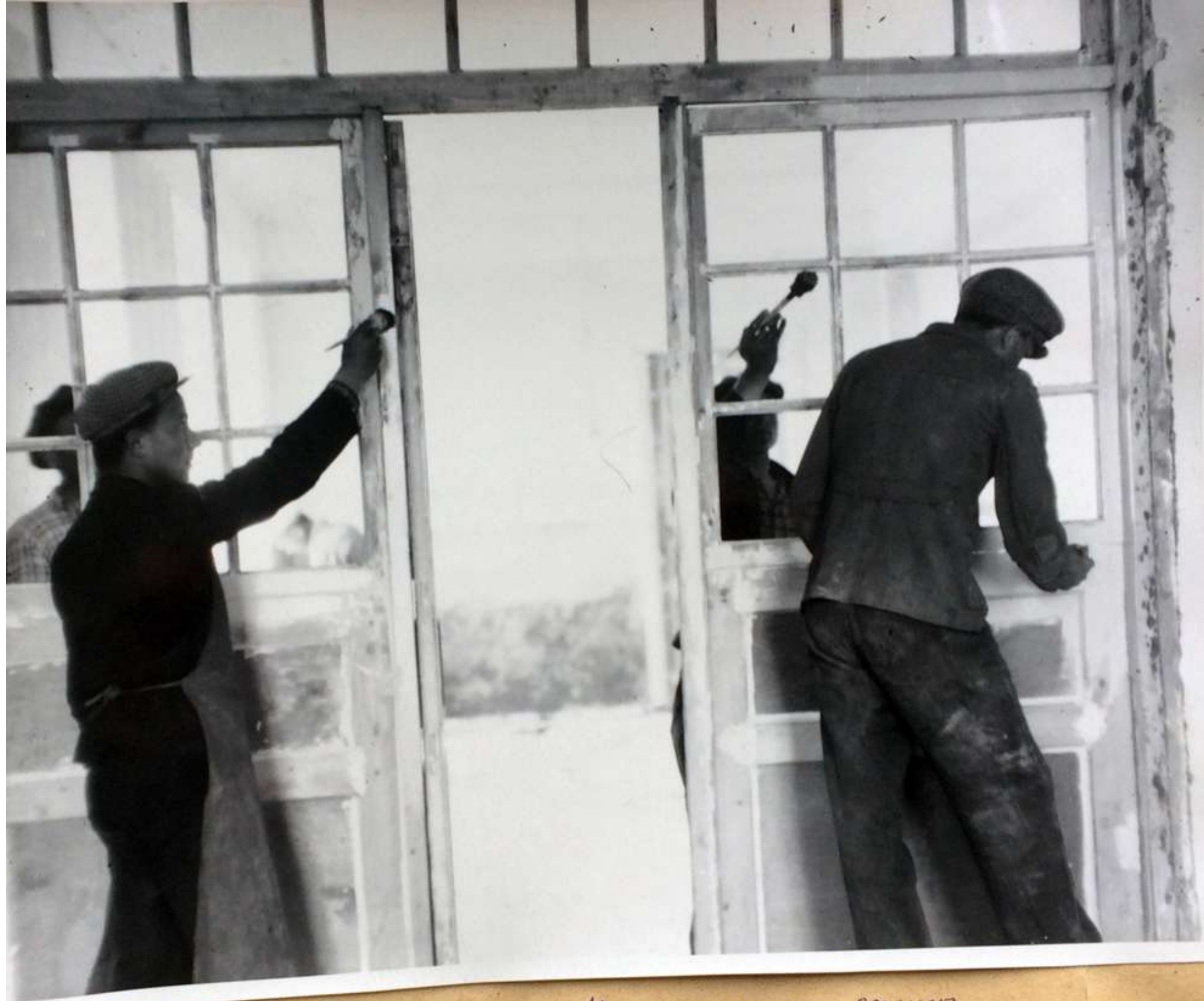
Масляная окраска веранды.