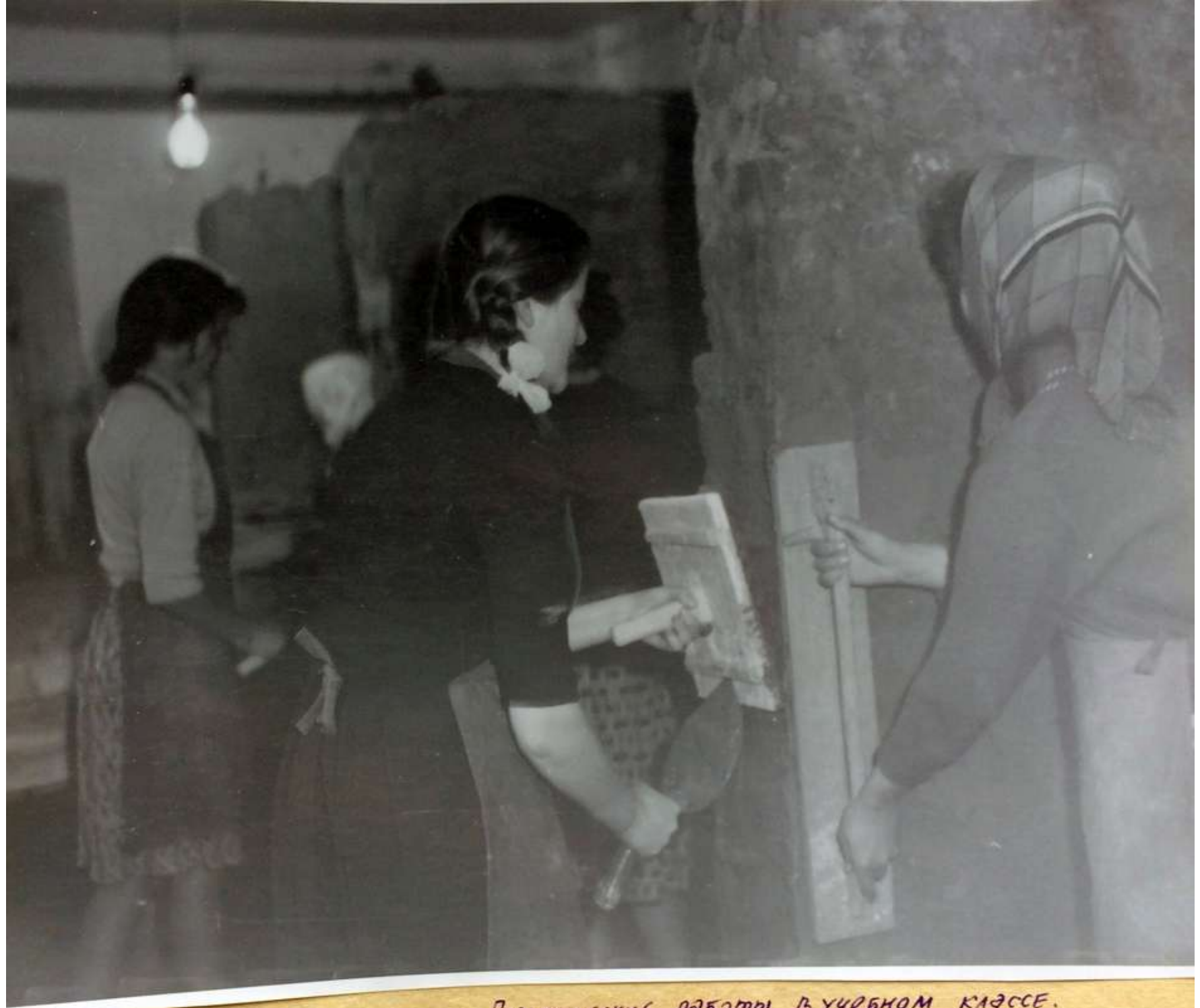
Практические работы в учебном классе. Оштукатуривание стен.