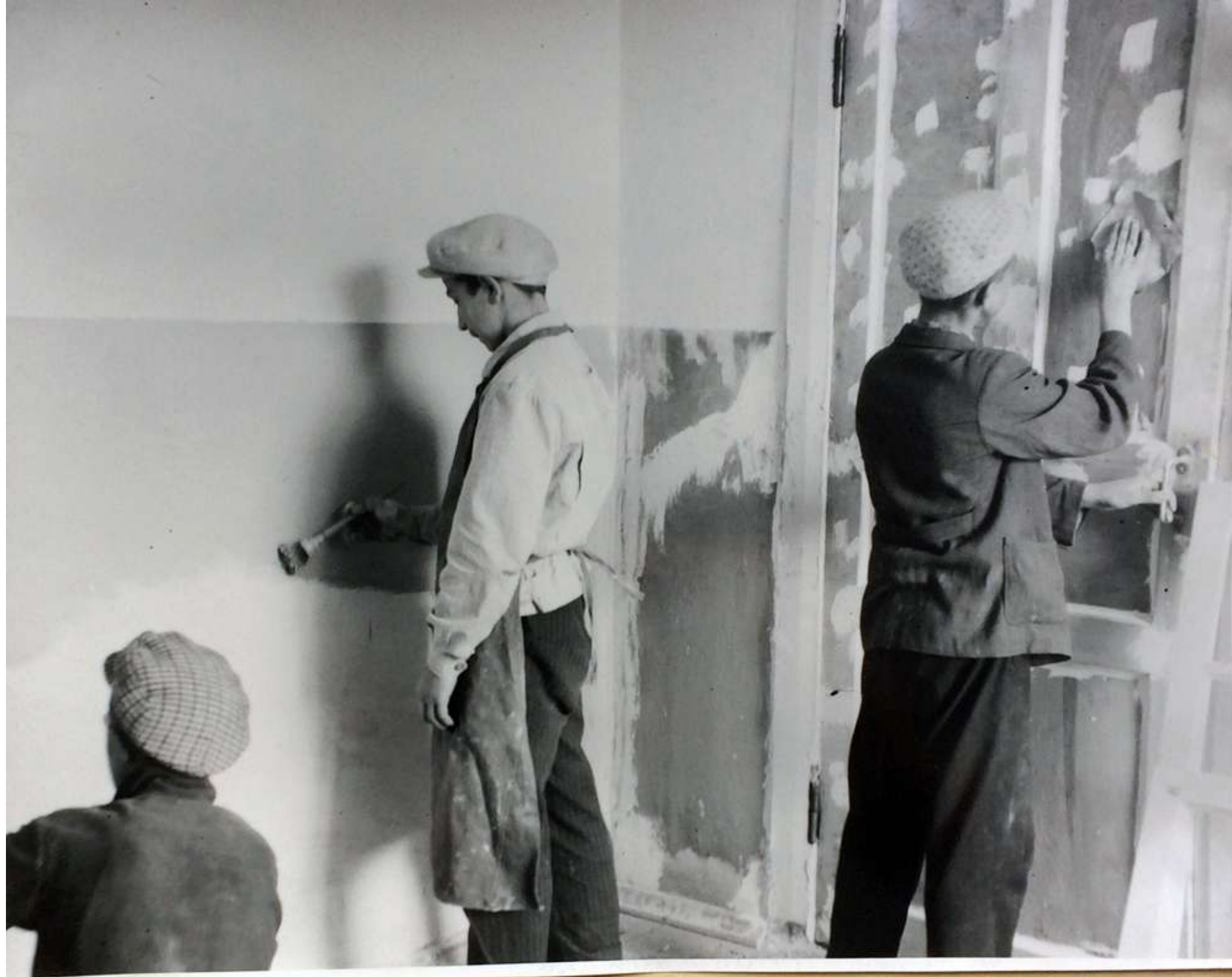
Маллярные работы в детских яслях. Окраска панели и шпаклевка дверей комнат.