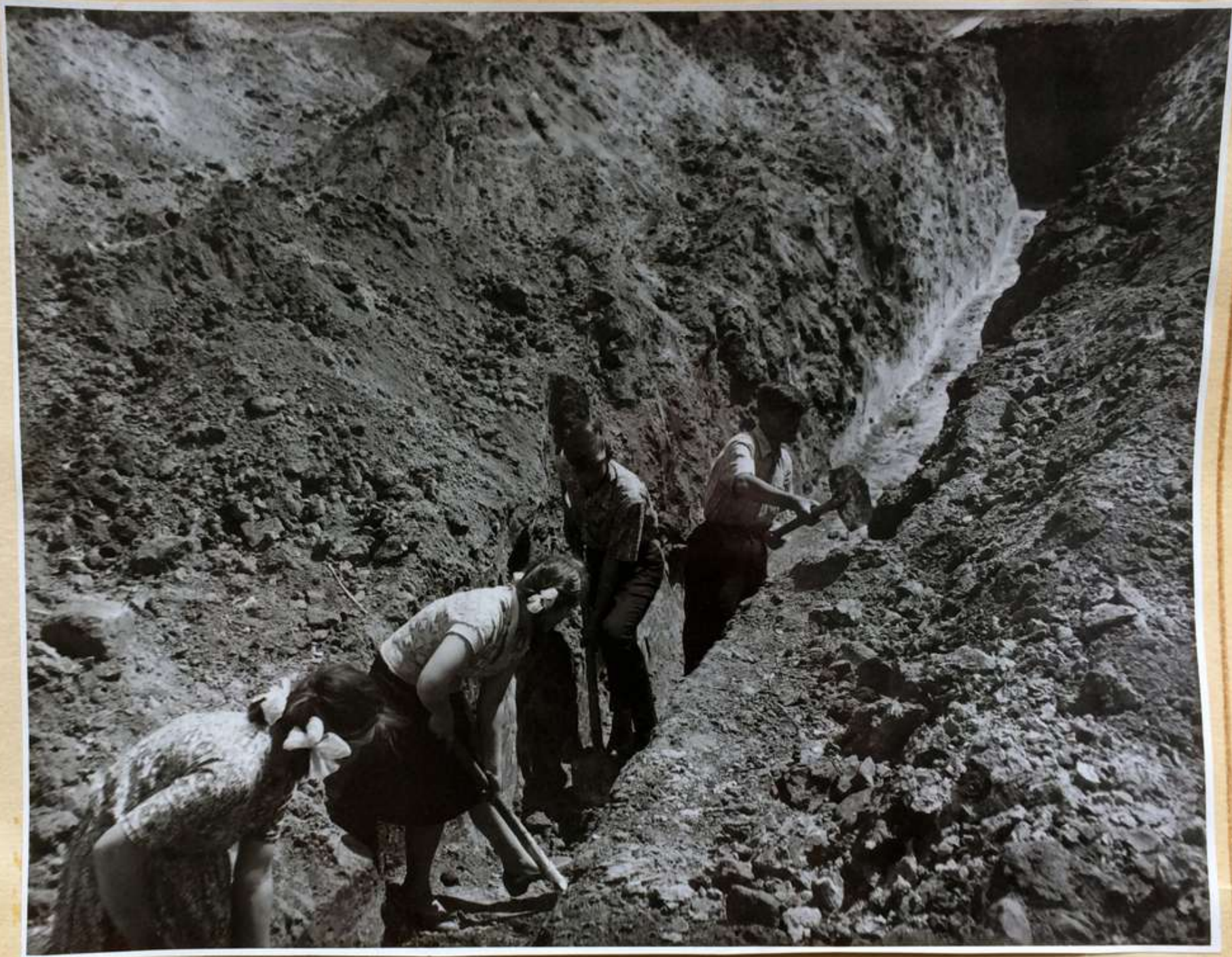
Подчистка траншеи под фундамент коммунального здания