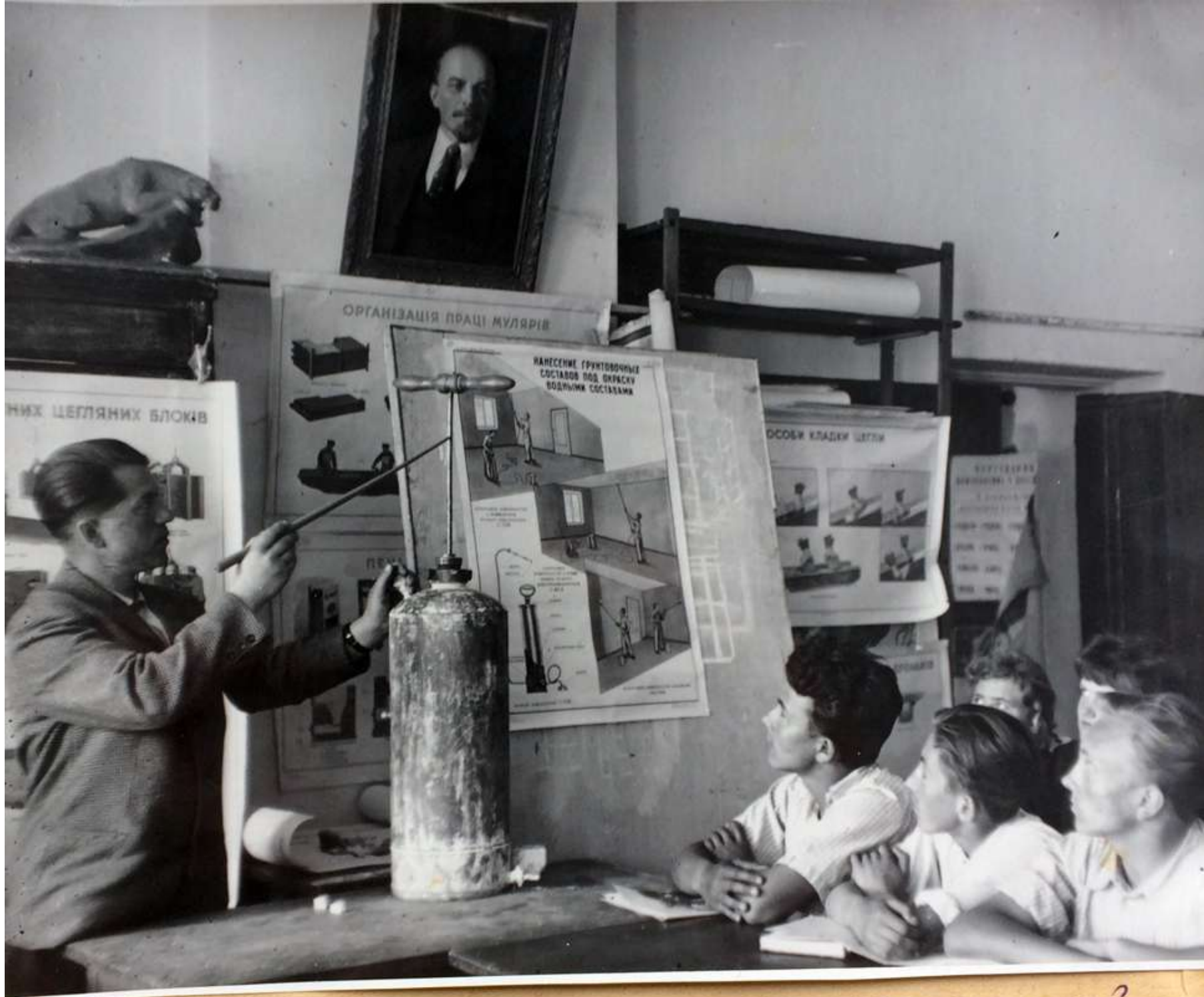
Как работает краскопульт?