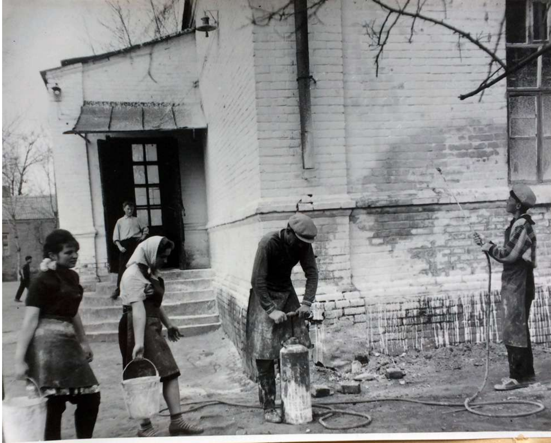
Окраска стен здания школы.