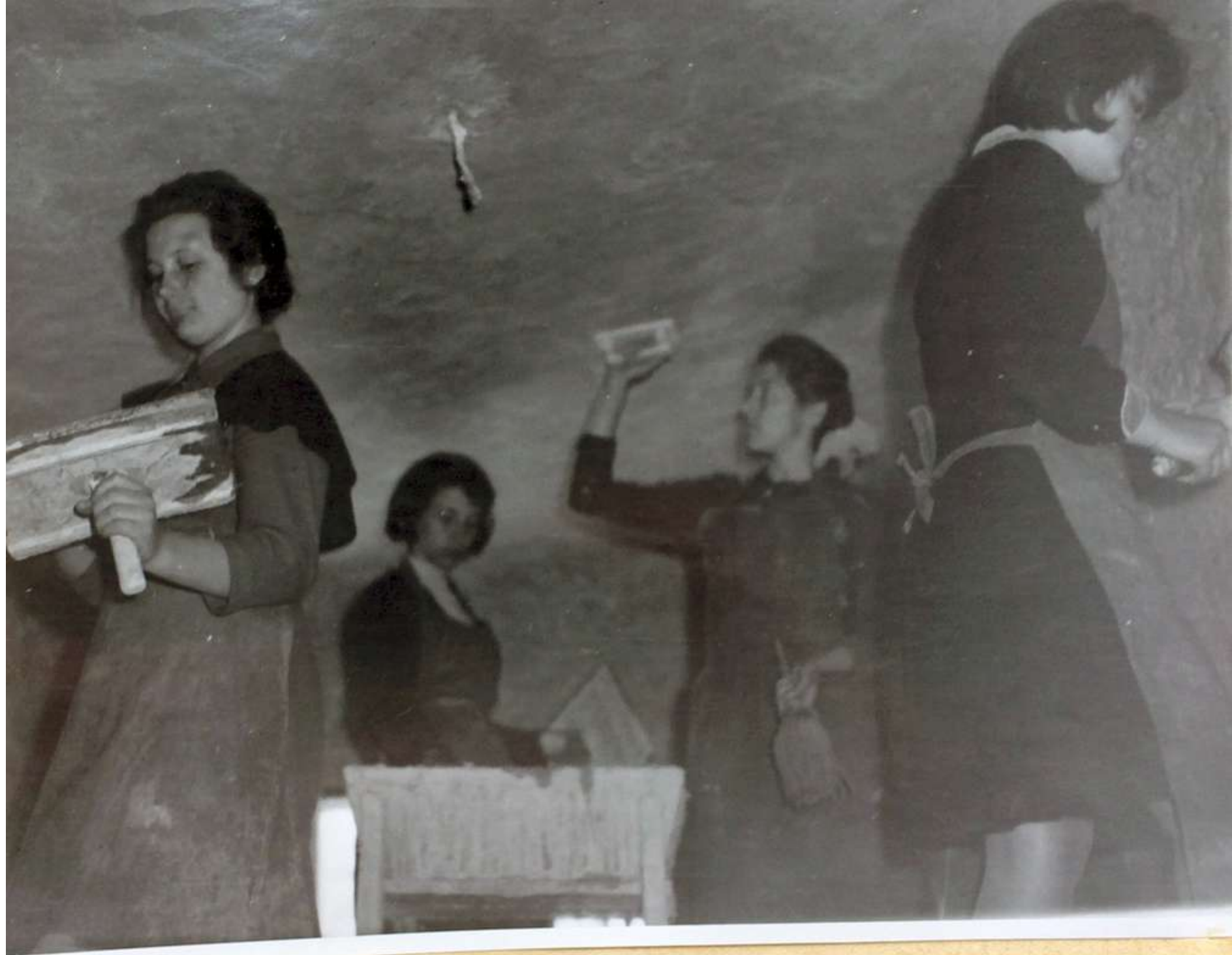
Оштукатуривание потолков в здании горсовета