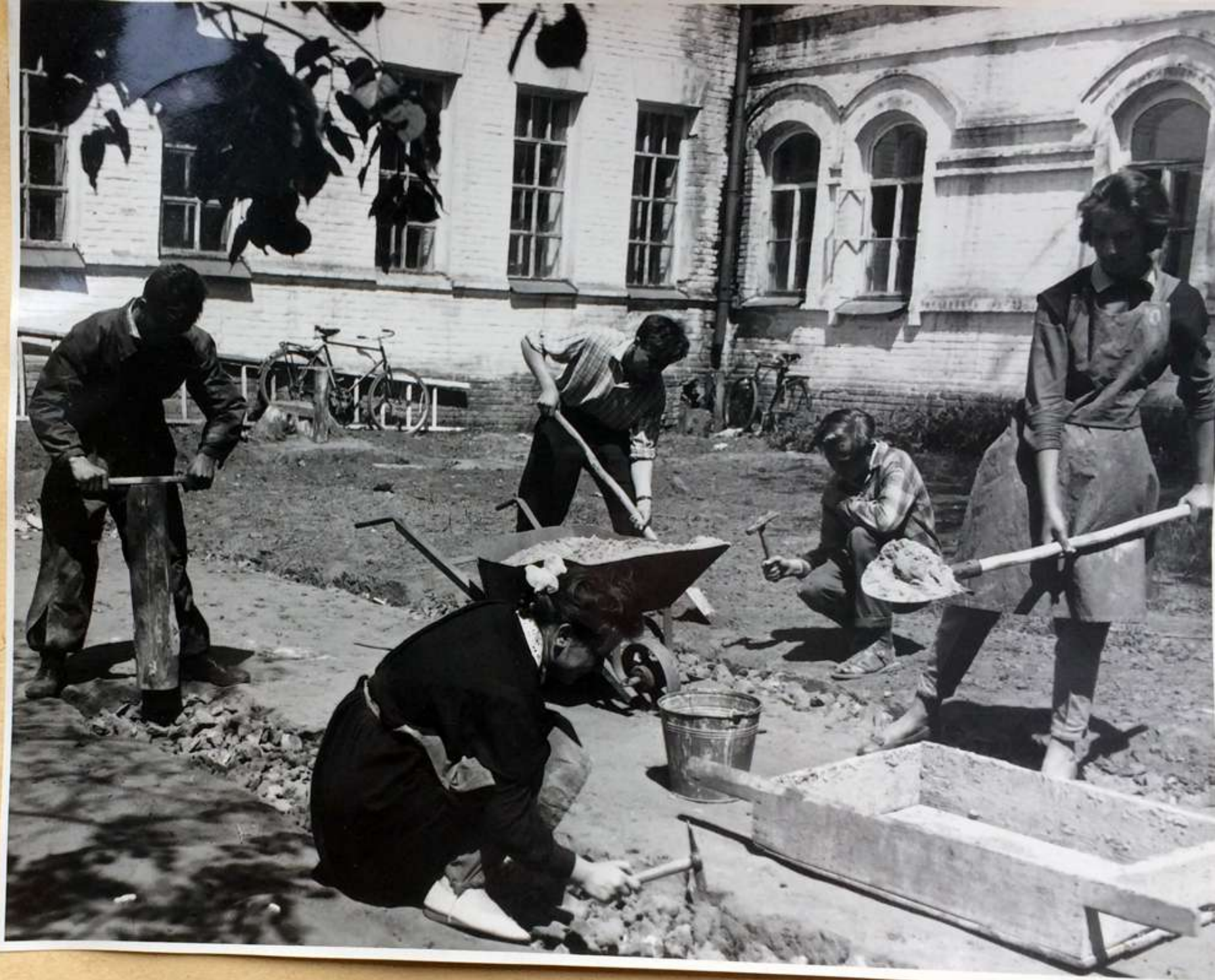
Каменщики. Устройство фундамента к /городка.